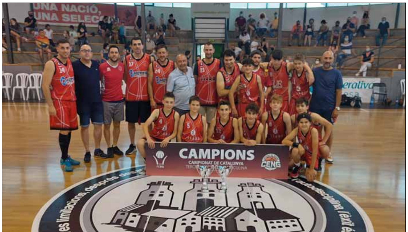
Dos equips del CENG han quedat campions de les respectives categories aquesta temporada, els sèniors a 3a Catalana i els infantils al grup 4 d'Interterritorial catalana, aquests amb l'afegit de no haver perdut cap partit. Felicitats! | CENG