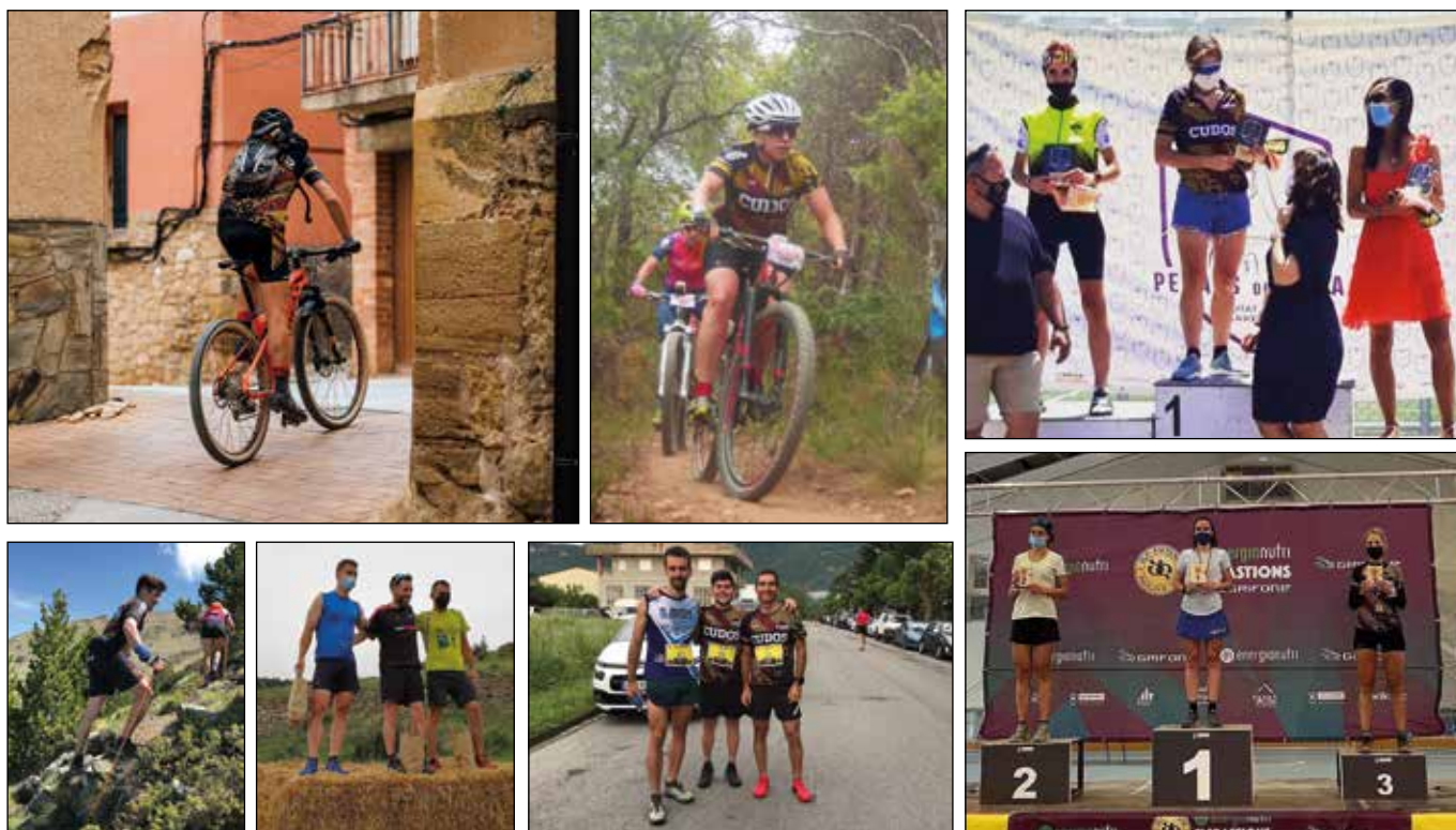
D'esquerra a dreta i de dalt a baix, Ultra Garrigues (2), Pedals de Dona, Berén-St Quiri, Àreu, Cames de Ferro i Bastions