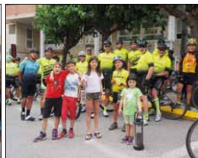
A dalt, sopar popular i concerts i a baix, foguera i arribada de la flama del Canigó a peu i en bicicleta | M.À. López i Jordi Farré