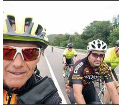
Última sortida d'esquí de muntanya a l'Aneto i acompanyament de la flama del Canigó