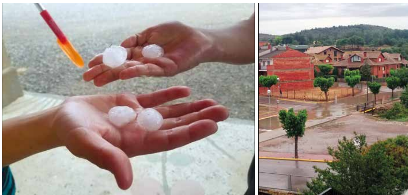
Un detall de les grans dimensions de la pedra al nucli d'Artesa, que també va quedar al pas de la forta tempesta

cies la pòlissa els surt cada any més cara. “Ens consideren de risc”, bromeja.