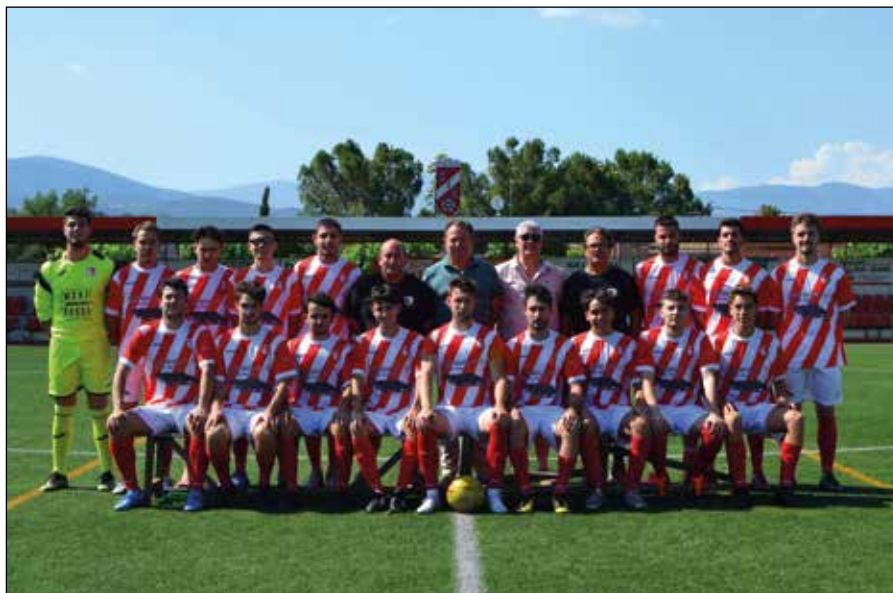
La regularitat de l'equip ha estat clau en la consecució del títol de lliga

Des d'aquestes línies volem agrair el suport de l'afició, molt nombrosa