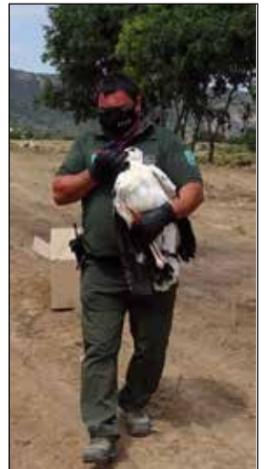
Activitats en el marc de la Setmana de la Sostenibilitat | Escola Els Planells

E l Dia Mundial del Medi Ambient (DMMA) se celebra cada any el 5 de juny i és el principal vehicle de les Nacions Unides per fomentar la sensibilització i l'acció a nivell mundial per a la protecció del nostre medi ambient. Cada any es basa en un tema nou que les grans corporacions, ONG, comunitats, governs i celebritats de tot el món adopten per promoure causes ambientals.