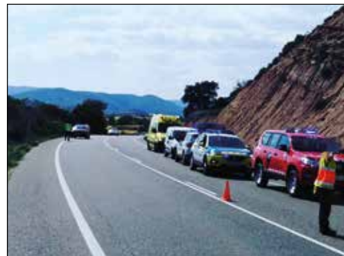
D'esquerra a dreta i de dalt a baix, incendi de vegetació a Artesa, foc en contenidors i accident el 28 de maig