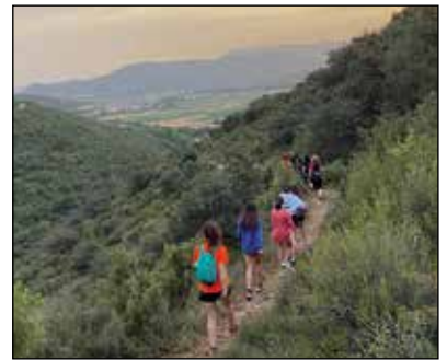
A dalt, els campions a les respectives categories, i a baix, sèniors recollint el trofeu, equip mini i caminada | CENG