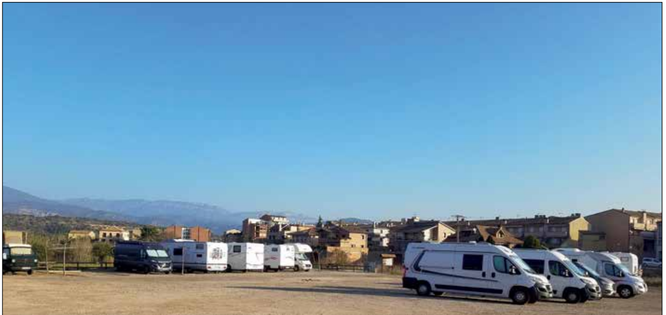
L'aparcament, situat al costat de l'escola i l'institut, a la carretera de Montsonís, va estar ple totes les vacances