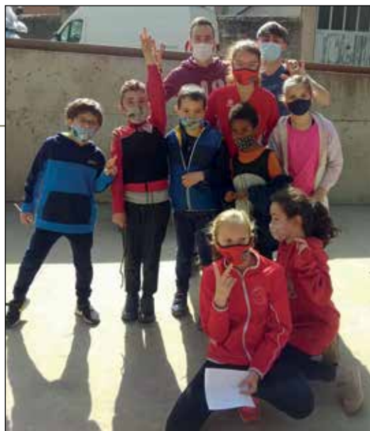
A l'esquerra, equip senior CENG Segrevest i a la dreta, el Campus de Setmana Santa