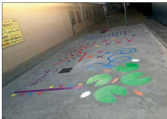
L'AFA ha aprofitat les vacances per pintar un circuit | AFA