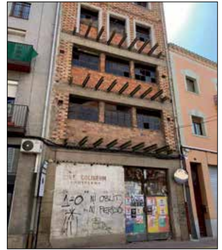
Una façana de la carretera d'Agramunt