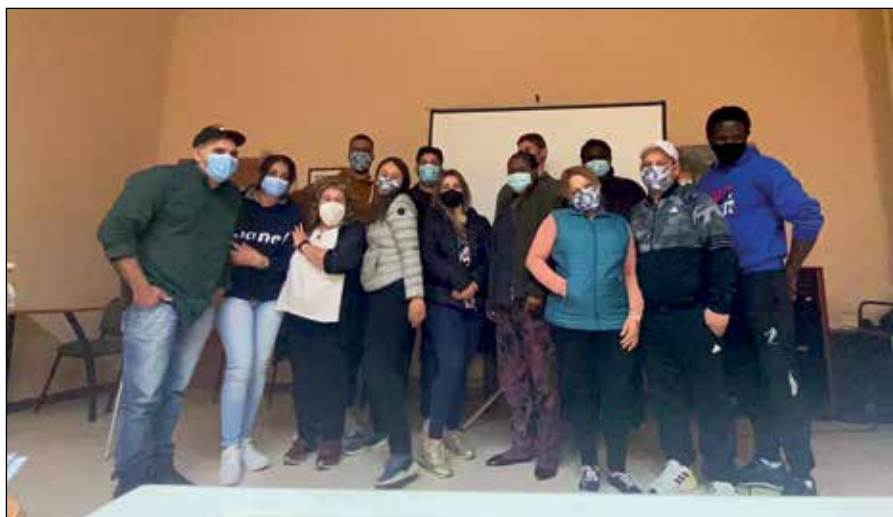
Foto de grup dels participants del curs d'aquest any

decidit demanar des d'aquestes línies que els parlem en català, que no passem directament a parlar-los en castellà pel simple fet de ser d'un altre país, que els hi donem temps i