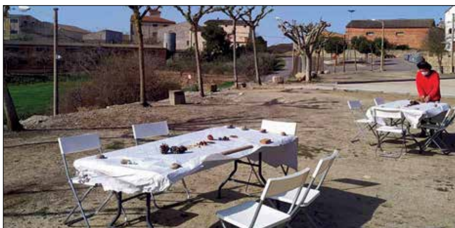
Cues de l'operació tornada i activitat a l'Espai Transmissor

dència abans de la pandèmia, però sí que aprecia un increment d'activitat en castells i restauració.