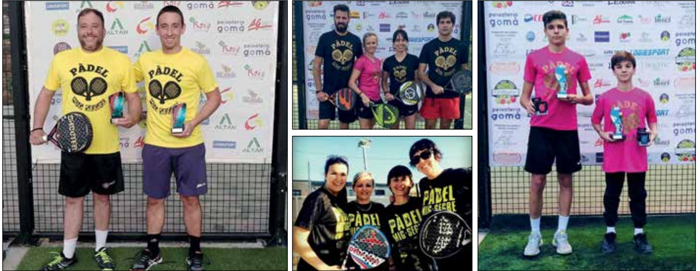
Alguns dels participants de les diferents categories dels tornejos celebrats des de 2016 | Mig Segre Pàdel

Aquest any es compleixen sis anys de la construcció de la pista de pàdel d'Artesa, situada a l'entrada de la població venint des de Balaguer, davant de la benzineria.