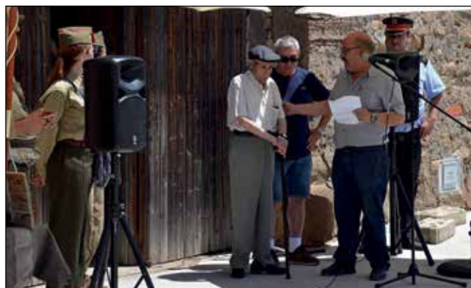
Recreació històrica de la Guerra Civil feta a Tudela de Segre | Biblioteca d'Artesa

panyarà fins a Aranda de Duero. Però sigueu pacients, ja hi arribarem, a aquest punt.