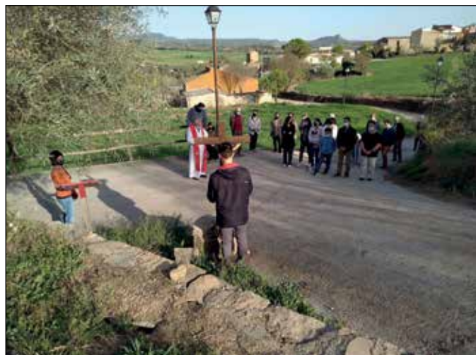
A l'esquerra, acte vandàlic al safareig i a la dreta, viacrucis de Divendres Sant | EMD Baldomar