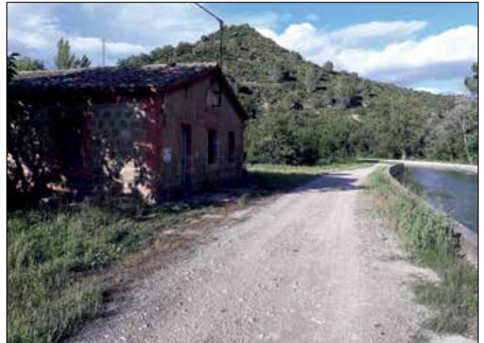
La "casilla" de les Bruixes, al costat del barranc | R. Giribet